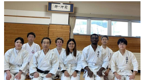
(2023年2月留学生卒業追出し稽古)

運動部をやり遂げた人は就職にも強いといわれています 空手部には、金融、メーカー、公務員など様々な業界に OBがおり、就活相談もできます